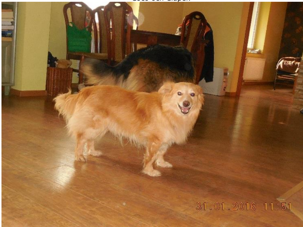
Wafel i sitt nya hem