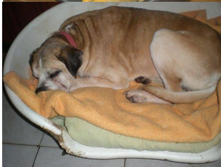
Stef med Mucha och Sylwek