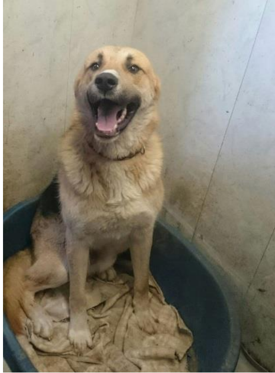
Coco och Ciapek